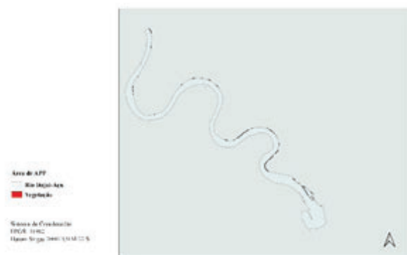
Figura 3. Vegetação remanescente ao longo do rio Itajaí-Açu no Município de Navegantes – SC.

De acordo com o buffer realizado a partir da imagem do Bing Satellite (2015) a área total de preservação à margem norte do rio Itajaí-Açu deveria ser de 28,109 hectares, entretanto contabilizou-se que existe apenas 6,215 hectares de vegetação remanescente nesta área, conforme aponta a figura 3.