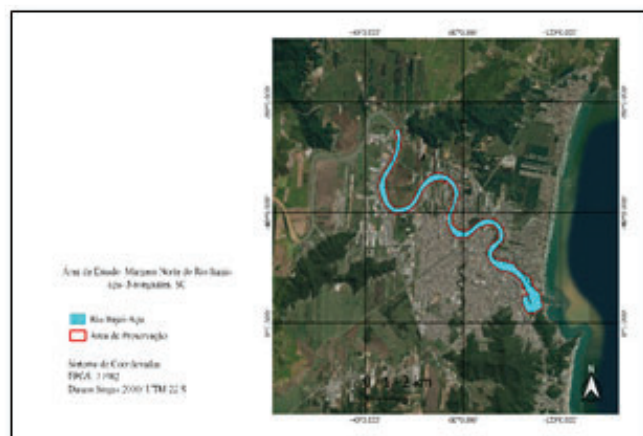
Figura 1. Localização da área de estudo no município de Navegantes.

cerca de 15.000 km 2 , correspondendo a 16,15% do território no estado. O maior curso d'água da bacia é o rio Itajaí-Açu, formado pela junção dos rios Itajaí do Oeste e Itajaí do Sul, no município de Rio do Sul. Este, apresenta comprimento de 188,0 Km de extensão, ocupando 2.780,0 km 2 de área total da bacia. O presente estudo condiciona-se à margem norte do rio Itajaí-Açu, em área urbana consolidada no município de Navegantes no estado de Santa Catarina, conforme é apresentado na figura 1.