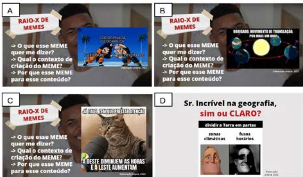
Figura 8. “Raio-X de memes” aplicados aos memes da Cartografia Escolar (apresentação no Canva)

Cartografia ou ( carto )memes, servindo como forma de retomada dos assuntos cartográficos trabalhados em aula pela professora titular de Geografia da instituição. Os ( carto )memes, que propiciaram aos alunos a possibilidade de compreender os conteúdos sob o viés da memética aplicado à Cartografia Escolar, trataram dos seguintes temas: coordenadas geográficas, movimentos da Terra (rotação e translação), estações do ano, zonas térmicas e fusos horários. Eles foram apresentados de modo que facilitasse o diálogo e a construção de interpretações coletivas dos memes. Para isso, fez-se uso de uma metodologia inédita, descrita em outro artigo, intitulada “raio-x de memes”, a fim de conhecer, verdadeiramente, o que cada texto memético visualizado expressa, isto é, qual a mensagem, informação ou conteúdo ele quer passar, além de fazer com que os alunos reconheçam, na prática, a riqueza e o superpoder dos memes (Figura 8).