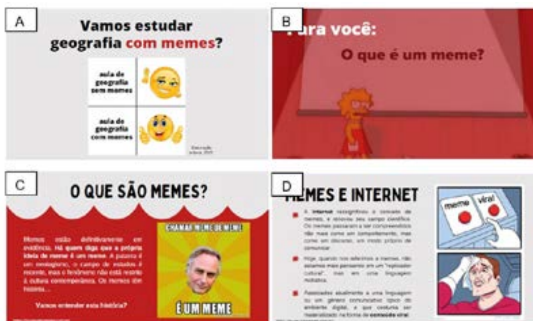
Figura 7. Alguns prints de tela da apresentação no Canva sobre a introdução aos memes e à memética.

No primeiro encontro com as turmas participantes da proposta que visa aproximar as representações meméticas da Cartografia Escolar, foi realizada uma introdução acerca das práticas a serem executadas ao que tange os memes e a memética enquanto potência comunicativa e que pode ser aplicada em contextos de ensino-aprendizagem. Tal apresentação ocorreu com o apoio de um material pedagógico produzido no Canva, pelos autores. Abaixo, pode-se verificar alguns slides que foram apresentados às classes nessa etapa da atividade (Figura 7).