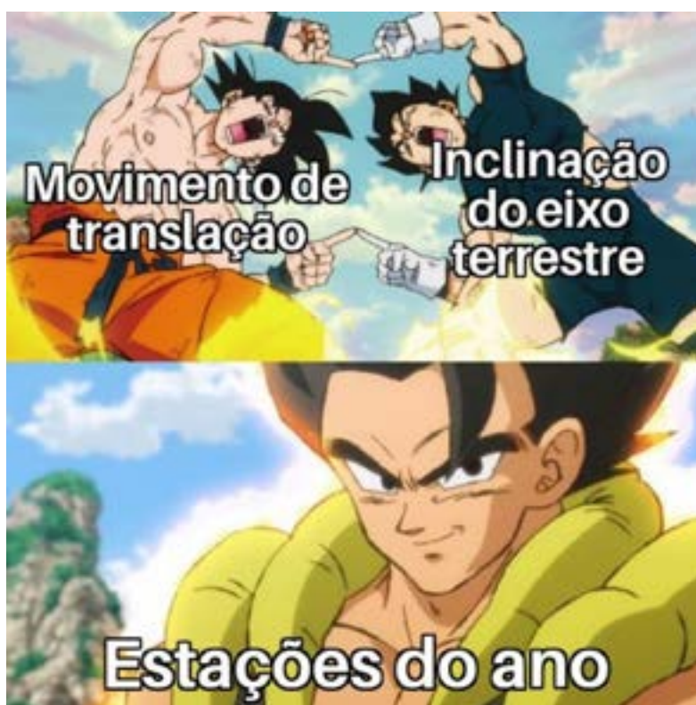
Figura 6. Meme do Dragon Ball aplicado à consequência do movimento de translação da Terra e a inclinação do seu eixo de rotação.

Apresenta-se, também, como possibilidade para o ensino de Geografia e Cartografia atento aos interesses do público jovem, tido como o principal consumidor de textos meméticos nas redes sociais digitais, uma das diversas versões do conhecido meme da fusão do anime Dragon Ball . O meme consiste na união de personagens diferentes, provocando resultados cômicos. Propõe-se, então, “[...] fundir dois conceitos que, ao se relacionarem, geram um novo conceito que possa ser profundamente estudado em sala de aula” (SANTOS et al., 2022, p. 74), como pode ser observado no meme abaixo (Figura 6) onde há a fusão do movimento de translação e do eixo de inclinação terrestre. Sendo os mecanismos responsáveis pela ocorrência das estações do ano, por sua vez, poderão ser mais bem estudadas a partir de tal meme, ficando perceptível, de uma vez por todas, o papel desse recurso multimodal como instrumento de mediação pedagógica capaz de estimular discussões sobre os conceitos/temas de Cartografia, não tendo somente função exibicional.