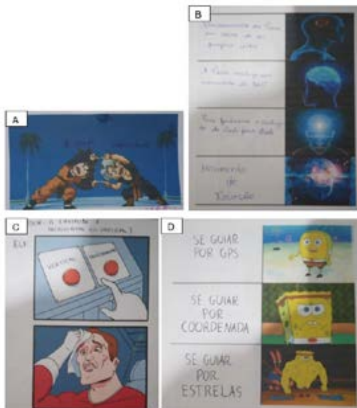
Figura 10. Alguns textos meméticos produzidos pelos estudantes.

Na Figura 10, por sua vez, o leitor pode visualizar alguns ( carto )memes elaborados pelos estudantes que demonstraram aptidão em relação aos conceitos/temas cartográficos na produção desses textos multimodais, além de revelarem certa sagacidade na compreensão dos recursos que um meme deve conter, sendo claro a presença do humor associado a situações do seu cotidiano nessas criações.