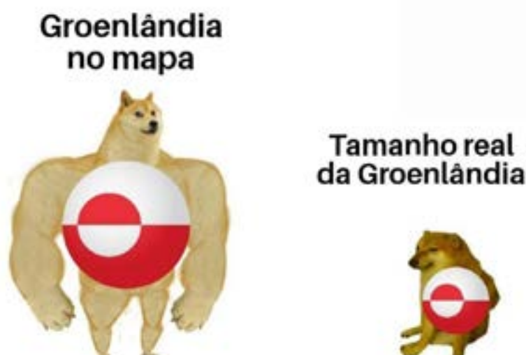
Figura 2. Meme do cachorro Balltze aplicado às distorções existentes na área de alguns países na projeção de Mercator.