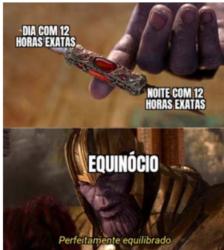
Figura 5. Meme do personagem Thanos aplicado ao conceito de equinócio.

Fonte: Elaborado pelos autores (2022), adaptado de Meme Generator.