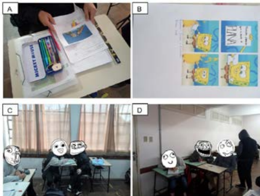
Figura 9. Criação dos memes de Cartografia pelos estudantes.