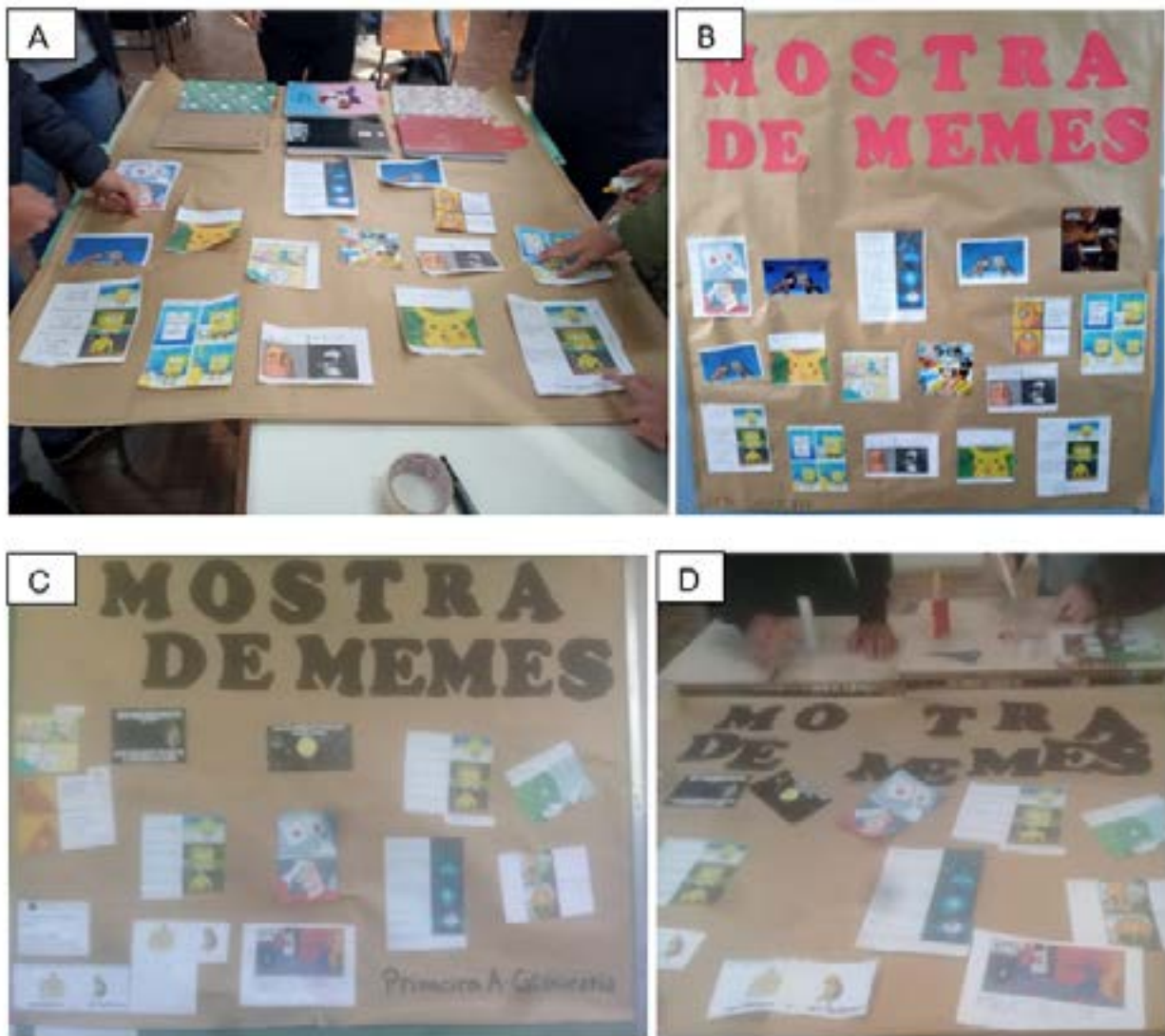
Figura 11. Momento de elaboração dos cartazes nas turmas dos Primeiros Anos A e B do Ensino Médio da referida instituição

Por último, como pode ser visto na Figura 11, foram construídos cartazes com os memes produzidos em cada turma com vista a socializar o material com os demais integrantes do corpo escolar, estimulando, assim, não apenas a internalização efetiva dos conteúdos cartográficos estudados, como também a intervenção emancipada e o sentimento de pertencimento dos estudantes diante do espaço geográfico escolar. Assevera-se, portanto, que o engajamento dos alunos para com as atividades propostas foi satisfatório, tornando possível assegurar, ao final deste trabalho, a relevância dos memes enquanto linguagem para o ensino de Cartografia e Geografia de modo a garantir uma aprendizagem significativa.