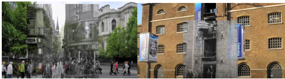
Figura 1: Realidade aumentada no Museu de Londres

Feira de Ensino, Pesquisa e Extensão Campus São Francisco do Sul