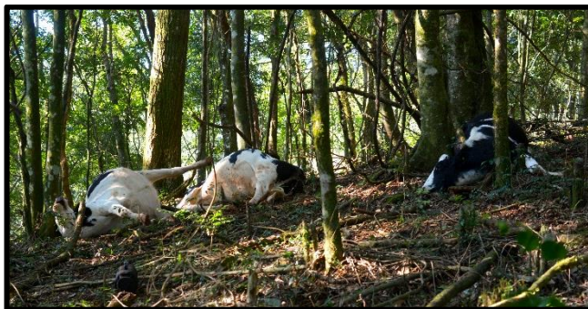
Figura 5. Mortalidade de bovinos devido intoxicação cianídrica por ingestão de Prunus sphaerocarpa .