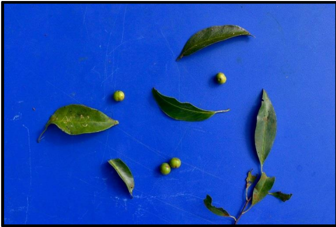
Figura 7. Folhas e frutos de Prunus sphaerocarpa .

No Sul e Sudeste do país, P. sphaerocarpa ou pessegueiro-bravo (SAAD & CAMARGO, 1967, GAVA, et al. 1992) e C. dactylon ou Tifton (GAVA, et al. 1998) são as principais espécies envolvidas em intoxicações por HCN (JUFFO, 2012). No oeste catarinense, especialmente na região do Alto Uruguai, a atividade leiteira vem sofrendo intensificação nos últimos anos, devido a busca pelo aumento da produtividade por área, sendo os sistemas semi-intensivos ou intensivos os que tem predominado. Dessa forma, é crescente a preocupação em reduzir os prejuízos econômicos, devendo os veterinários ficarem atentos a essa intoxicação, sempre realizando necropsia e testes toxicológicos em casos suspeitos.