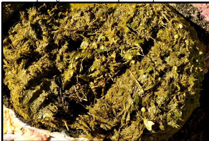
Figura 6. Conteúdo ruminal contendo folhas e frutos de Prunus sphaerocarpa parcialmente digeridas.

Na pecuária é comum contaminação das pastagens por plantas invasoras e, entre estas, espécies tóxicas aos animais, que acarretam prejuízos econômicos ao produtor e danos à saúde do rebanho (FURTADO et al., 2012). Os sorgos ( Sorghum spp.) consistem de gramíneas anuais de verão, de adequado valor nutritivo e fácil cultivo. No Sul do Brasil, uma parcela considerável das áreas cultiváveis é destinada ao pastejo e/ou corte verde, em especial, na bovinocultura leiteira. As gramíneas do gênero Sorghum possuem quantidades variáveis de glicosídeo cianogênico. A presença do componente tóxico depende do estágio em que a planta é consumida (brotamento ou rebrote). O óbito acontece,